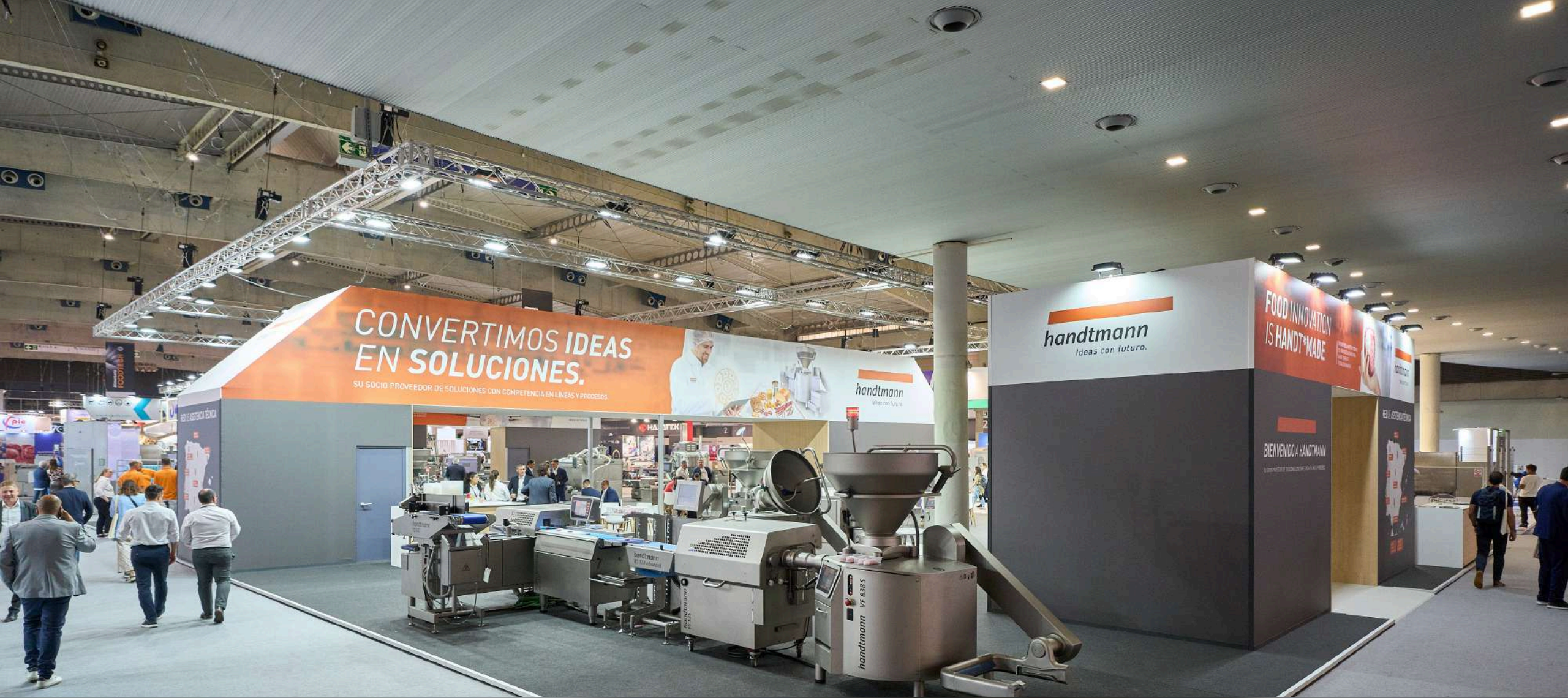
ALIMENTARIA FOODTECH HANDTMANN