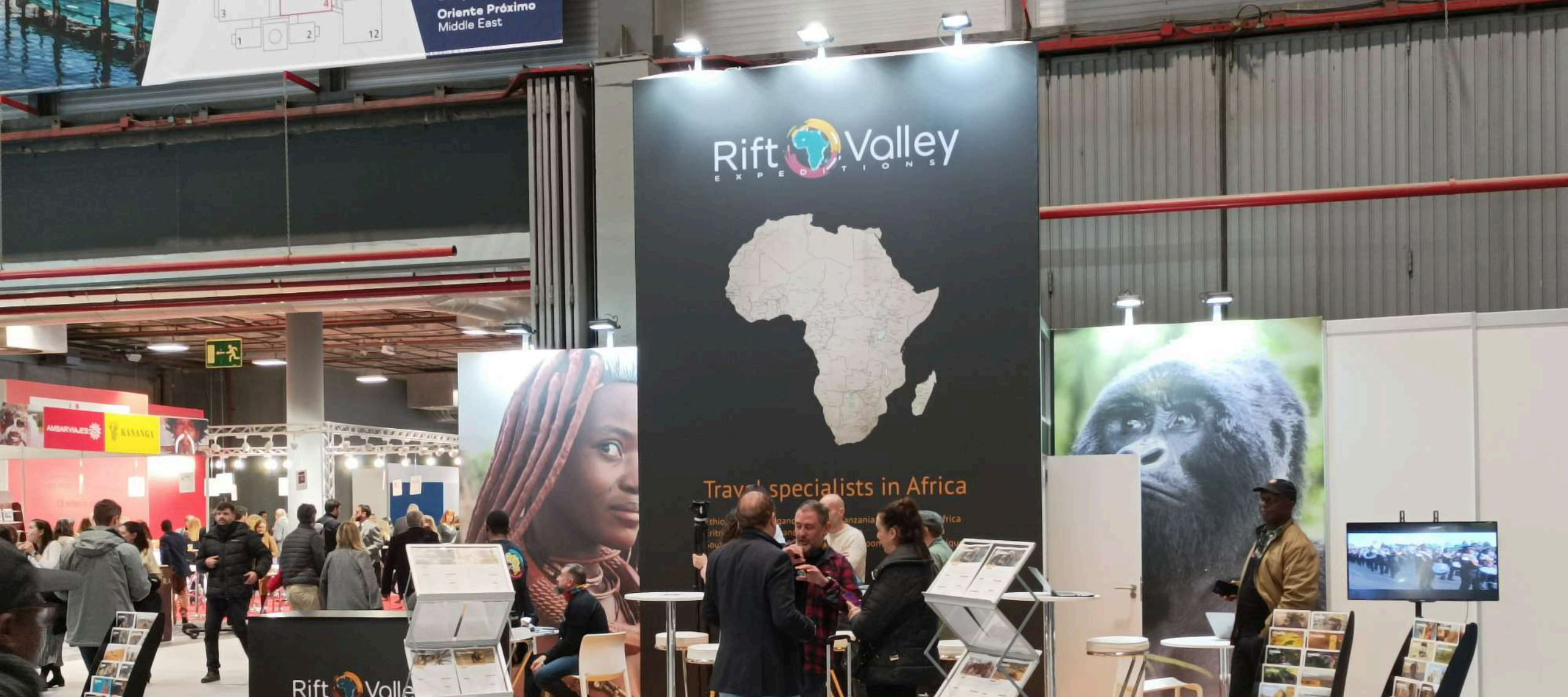
FITUR RIFT VALLEY